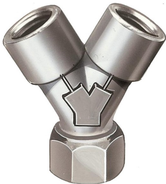
Raccordo Y 1/4" Femmina